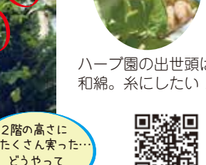
ハーブとヘチマの種