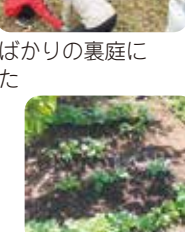
手作りの落ち葉入れ