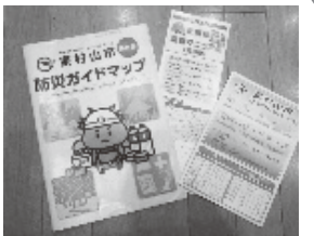
「東村山の水害を考える」では、市の情報を持ち寄って、備えや不安についておしゃべりしました。

連続講座「おいしいごはんたのしいごはん」、埼玉県自由の森学園の社会科の先生による授業「憲法ってなんだっけ?」、アナグマの会と共催「ころころからだ塾」「東村山市の水害を考える」おしゃべり会を開催しました。