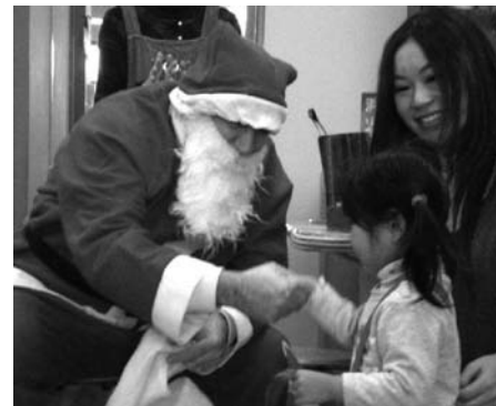
ぶくぶくでできたサークルさんが主催のクリスマス会にサンタさんが来てくれました。