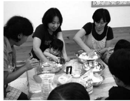
手でこねこね、小麦粘土遊び。 手の感触が、気持ちいい!