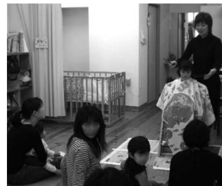
美容師さんに来ていただいて、子どものヘアカットのポイントを教えてくださいました。