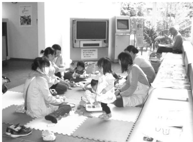
通り道なので、気軽に寄ってみてください~い!